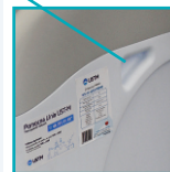
Держатели для удобного переноса кабинета