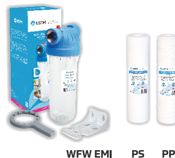
WFW EMI PS PP

Для защиты умягчителя от механических загрязнений с водопровода рекомендуем установку предварительного фильтра с серии WFW с механическим картриджем серии PP или PS. Магистральный фильтр, оснащенный кнопкой деаэратора и латунной резьбой, предлагаем в комплекте с кронштейном и ключом. По выбору три размера подключения: 1/2", 3/4", 1".